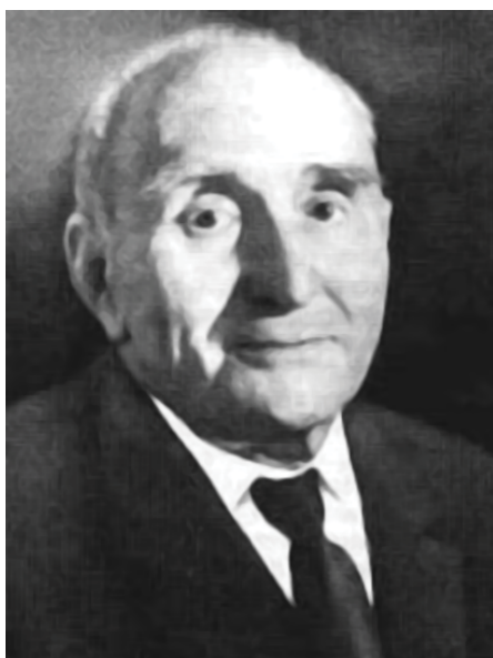
Рисунок 1. А.П. Фрумкин (1897 – 1962) Figure 1. A.P. Frumkin (1897 – 1962)

Образ выдающегося учёного, блестящего хирурга-уролога и педагога не стирается временем. Его идеи и дела живы и в наше время. Разумеется, в свое время, по тогдашнему уровню научной и практической урологии, Анатолий Павлович не мог многое предвидеть. Но есть такие разделы в хирургии и урологии, дальнейшее развитие которых невозможно отрывать от идей, связанных с именем этого учёного.