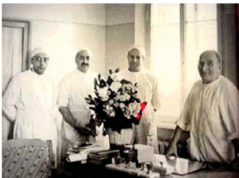
Рисунок 8. А.П. Фрумкин среди своих коллег (на фото первый справа) Figure 8. A.P. Frumkin among his colleagues (pictured first on the right)