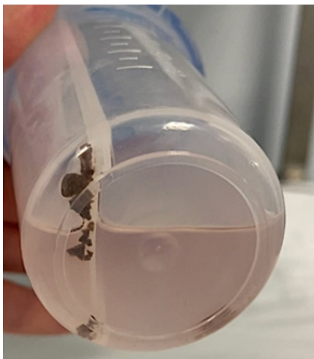
Рисунок 3. Контейнер с мелкодисперсной пылью и фрагментами конкрементов после ТНЛ с применением аспирационного кожуха ClearPetra Figure 3. Container with fine stone dust and fragments collected after TUNL using the ClearPetra aspiration sheath

Оценивали следующие параметры: время оперативного вмешательства, время литотрипсии, длительность госпитализации; уровень SFR на основании МСКТ почек и мочевыводящих путей проведённой на первые сутки и через 3 месяца после оперативного вмешательства; послеоперационные осложнения — по классификации Clavien-Dindo.